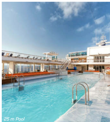
25 m Pool