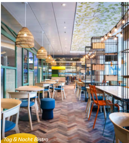
Tag & Nacht Bistro